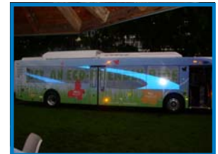
Nouvo otobis dizèl Broward County Transit yo pral kapab pran jiska 38 pasaje, epi yo pral genyen ladan yo sistèm modèn, ki pwoteje anviwonman.

estasyon yo, epi li gen plizyè lòt zouti ki bay moun k ap sèvi ak transpò yo anpil opsyon