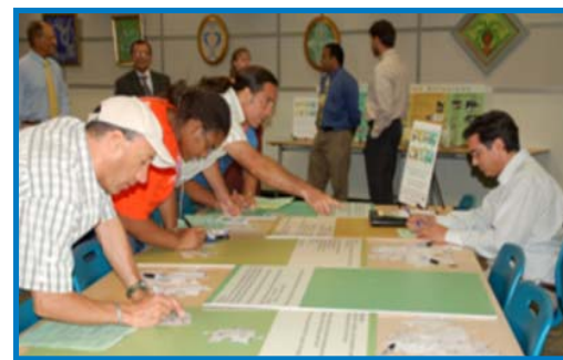
Atelye sou LRTP 2035 yo te òganize nan South Regional Library nan Pembroke Pines lan, nan 29 jiyè 2008

Kounye a, MPO Broward la ap pran dispozisyon pou pase men sou Plan Transpò pou Kouvri Anpil Tan (LRTP) 2030 lan. Nouvo LRTP 2035 lan pral gide investisman nan transpò nan zòn Broward County a pandan 25 an ki pral vini yo, avèk kòm objektif pou reyalize pi bon koneksyon ki posib pou deplasman nan rezo transpò nou an.