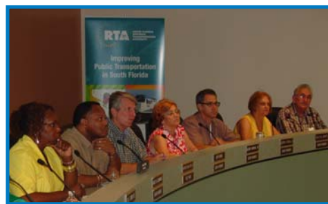
Reprezantan CIR Broward la, ak CTAC Miami-Dade la, ak CAC Palm Beach la te sèvi kòm gwoup oratè pou reyinyon 2008 la.