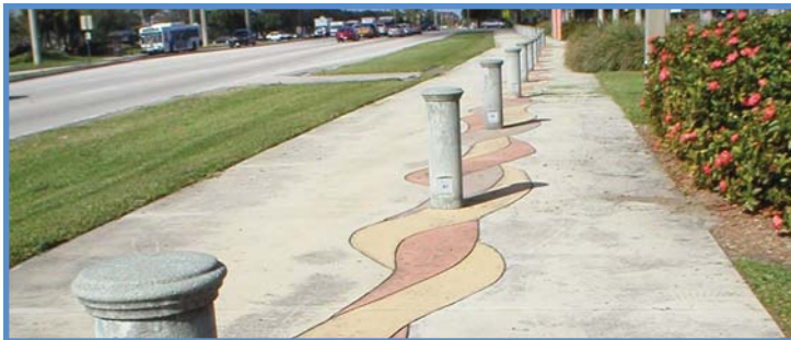
Coconut Creek Parkway resevwa plizyè sibvansyon pou l fè chanjman pozitif pou trajè k ap fèt nan koulwa a, ikonpri rann twotwa a pi bèl.

Coconut Creek Parkway, yon anplasan prensipal pou plizyè kanpis edikatif, ki pwolonje de (2) mil an longè, se yon wout a kat vwa kote mitan wout la lakoz anpil enkyetid onivo sekirite. Vil la ansanm avèk kolaboratè l yo devlope yon plan prensipal pou ekstansyon wout sa a ki pral transfòme l an yon pak lineyè k ap atire pyeton yo. Li enkli ladan l twotwa pou pyeton k ap gen limyè pou sekirite ak pou estetik, avèk konstriksyon yon sant transpòtasyon kominotè.