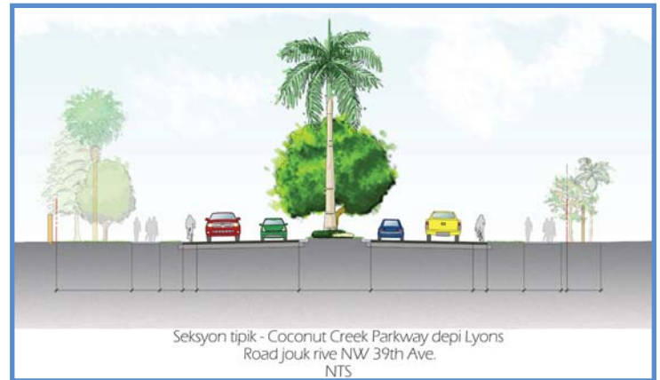
Seksyon tipik - Coconut Creek Parkway depi Lyons Road jòk rive NW 39th Ave. NTS

Etablisman edikatif yo ansanm avèk Koulwa Edikatif la gen yon popilasyon yo estime a pliske 20 000 elèv ki fouldaym ak pat-taym, ak yon popilasyon rezidansyèl de 18 000 ki lokalize a 1/4 a 1/2 mil de distans. Faz sa a nan pwojè a pral konekte etablisman edikatif yo tankou Atlantic Technical Center, Coconut Creek High School, Broward College ak Broward County Library. Yon fwa amenajman yo pwopoze pou Koulwa Edikasyon an konplete, etablisman edikatif yo ap aksesib ant youn lòt pa otobis, navèt, bisiklèt oswa apye. Redevlopman sa a de Coconut Creek Parkway a ofri yon opòtinite inik pou benefisyè plizyè minisipalite, ansanm avèk Konte a, onivo kalite lè a ak pwoblèm onivo sekirite.