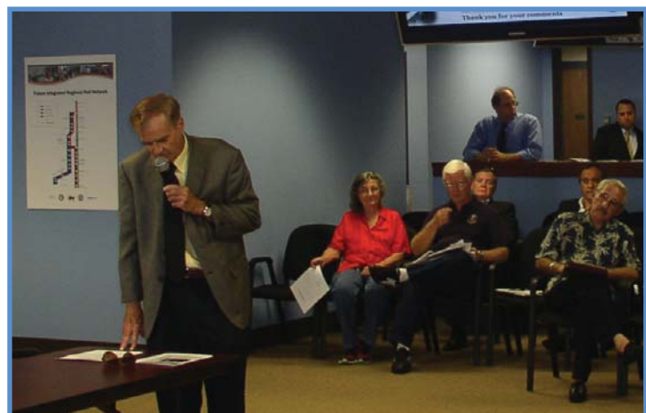
Plizyè manm piblik la te patisipe lè yo te ba yo opòtinite pou adrese ekip revizyon federal la pandan reyinyon piblik la.