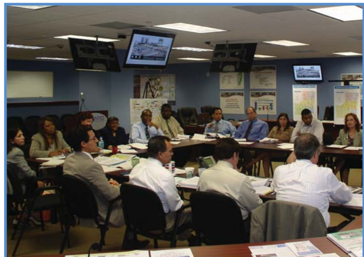
Pandan vizit dè lye ki fèt pandan de jou yo, manm Ekip Revizyon Federal la te chita avèk manm pèsònèl Broward MPO yo ak kolaboratè yo, pou patisipe nan yon sesyon tabwonn kote te gen Kesyon ak Repons, pou diskite sou kesyon planifikasyon onivo transpòtasyon lokal.

Manm Konsèy ak manm pèsònèl MPO yo ta renmen remèsye kolaboratè nou yo ki te patisipe aktivman pandan pwosesis revizyon an. Pami kolaboratè nou yo te gen prezantan Enstans nan Broward County (Broward County Transit), FDOT, Enstans Rejyonal pou Transpòtasyon nan Sid Florida (South Florida Regional Transportation Authority) ak Port Everglades.